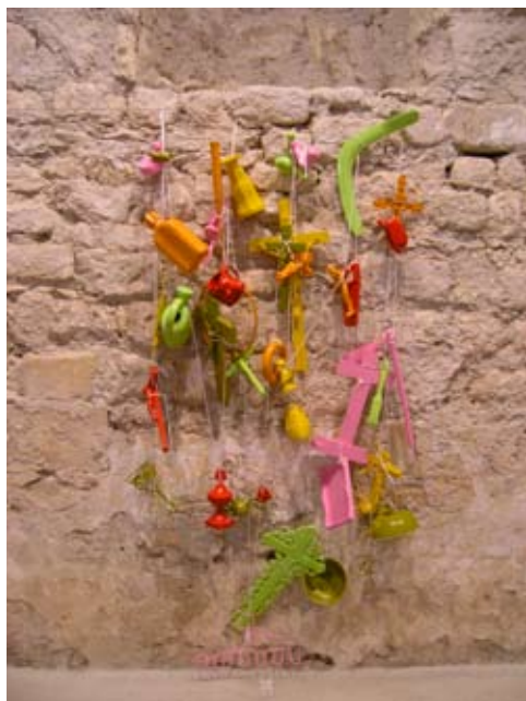
Franck Bragigand, Jour de Fête , objets divers, 2009 © Franck Bragigand © Droit réservé Ass. LaCit/Adca22

Franck Bragigand est né en 1971 à Bettwiller (Bas-Rhin), il vit depuis plusieurs années à Amsterdam (Pays-Bas). Donner les couleurs de l'art au monde, telle est la mission qu'il s'est fixé. À l'origine de sa démarche artistique : la peinture n'est plus apposée sur la toile mais sur les objets qui nous environnent. Il redonne ainsi une seconde vie à des meubles, ustensiles et bibelots, récupérés çà et là en leur donnant de nouvelles couleurs. À Amsterdam, Osaka, Québec, Kyoto, Montréal ou Strasbourg, ses interventions occupent l'espace public : bureaux, bars, hall d'école maternelle, jeux d'enfants, plaques d'égout, mobiliers urbains, façades de maisons individuelles. Toutes ces surfaces deviennent pour l'artiste autant d'actes artistiques, s'inscrivant ainsi dans une nécessité citoyenne de donner à voir le monde autrement.