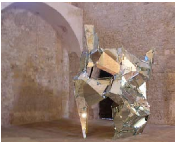
Baptiste Debombourg, Nickey , miroir, bois, 2009 © Baptiste Debombourg © Droit réservé Ass. LaCit/Adca22

L'œuvre produite sur place, intitulée Nickey , est construite à partir de la destruction d'un miroir, elle reflète son environnement immédiat et renvoie à l'univers de la fiction peuplé de héros fantastiques. Tel un masque en ruine, la forme fantomatique bancale semble au bord de l'effondrement.