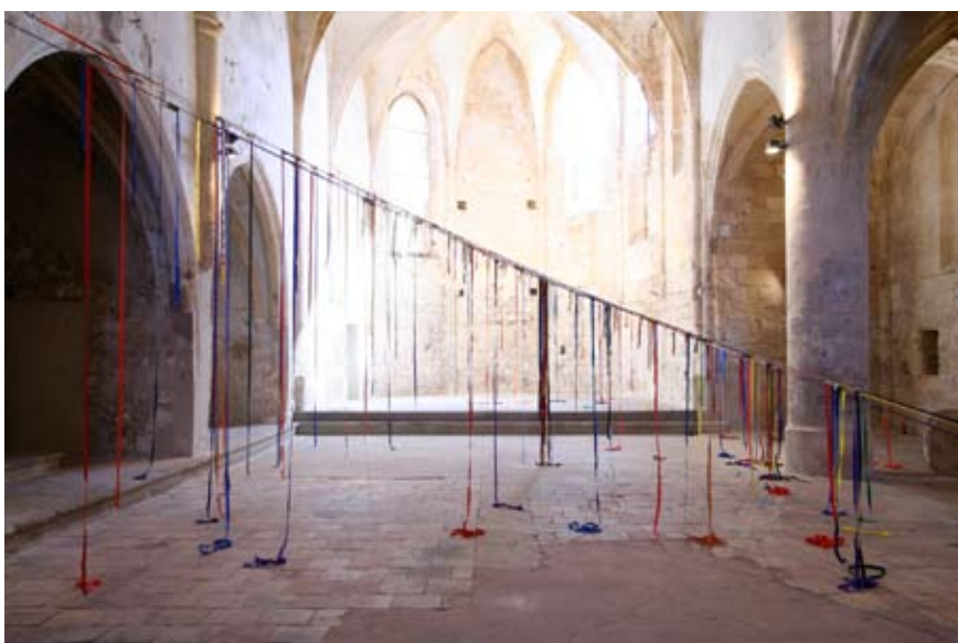
Vincent Mauger, Sans titre , sangles, 2007 © Vincent Mauger © Droit réservé Ass. LaCit/Adca22

Vincent Mauger est né en 1976 à Rennes et vit près de Nantes. Il travaille le plus souvent à partir de matériaux de construction ordinaires (brique, bois, tuyau en PVC) procédant par accumulation, taille et contrainte, l'artiste met en parallèle les techniques de construction avec les techniques d'imagerie virtuelle ou scientifique. Ses recherches portent sur la représentation sculpturale d'un souvenir ou d'une perception mentale d'un objet ou d'un espace. Les propositions de Vincent Mauger invitent le visiteur à s'approprier l'espace, à s'y déplacer, à redessiner à sa guise les contours d'un paysage ou d'une forme construite, à l'habiter physiquement et mentalement.